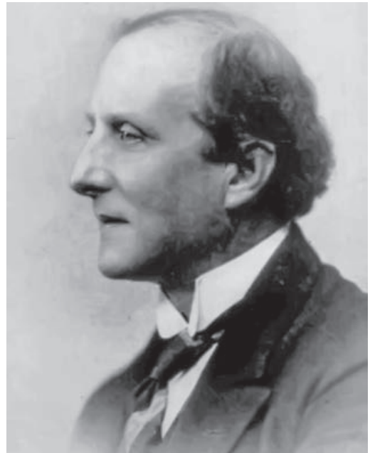
Κων/νος Καραθεοδωρῆς (1873-1950)

ρῆ ὡς ἐπιστήμονος, ὡς δασκάλου καὶ ὡς ἀνθρώπου. Τὸν διέκρινε σπάνια εὐφυΐα συνδυασμένη μὲ μεγάλη σεμνότητα. Εἶναι πλέον γνωστόν ὅτι ὑπῆρξε στενός φίλος καὶ δάσκαλος τοῦ μεγάλου Ἀϊνστάϊν, ὁ ὁποῖος ὁμολόγησε τὸ ρόλο τοῦ μεγάλου Ἕλληνα, στὴ διατύπωση τῶν θεωριῶν πού ἀποδόθηκαν σ' αὐτόν.